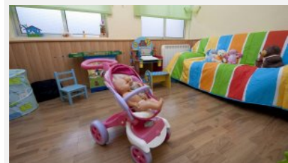
Juguetes esparcidos en una estancia de un piso que tutela la Asociación de Protección del Menor en Valladolid.