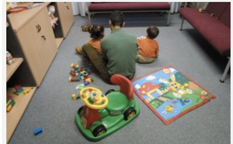
Las instalaciones de Ronda del Ferrocarril comenzaron a prestar servicio a mediados del año 2006 para atender casos de Miranda y localidades próximas.

Guarda y custodia. En 2 de los casos la Junta de Castilla y León era quien tenía la tutela de los menores.