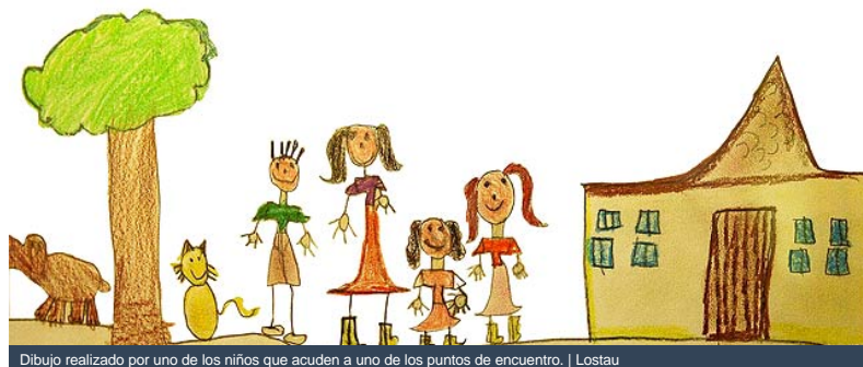
Dibujo realizado por uno de los niños que acuden a uno de los puntos de encuentro. | Lostau