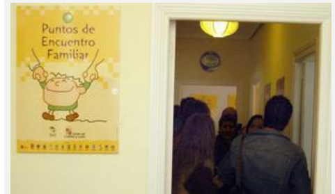
Punto de encuentro familiar de Zamora. LUIS CALLEJA

El capítulo IV establece el procedimiento para obtener la necesaria autorización, su posible modificación, así como lo relativo a la inspección, coordinación y seguimiento. En este sentido, se prevé la creación de dos comisiones para realizar tareas de coordinación, colaboración y seguimiento, así como la posibilidad de presentación telemática de las solicitudes, para lo cual los interesados disponen de los modelos normalizados de solicitud en la sede electrónica ( http://www.tramitacastillayleon.jcyl.es ), de conformidad con la normativa vigente en la materia.