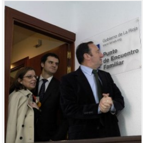
Las autoridades, en el punto de encuentro.

Sanz agradeció la colaboración del Consistorio calagurritano, que cedió a la Consejería un piso de propiedad municipal de la calle García de Nájera, y detalló que este servicio ha atendido, en toda La Rioja, a 342 familias y 478 menores. «En la actualidad tenemos 126 expedientes abiertos y se está interviniendo con 164 menores». El presidente también valoró que este servicio «da seguridad y confianza» y «consigue que los menores tengan una atención adecuada. Son los jueces los que autorizan este tipo de encuentros y visitas». Los puntos de encuentro familiar acogen visitas tuteladas, intercambios de menores y acompañamientos en salidas. Durante los últimos años, los técnicos han logrado que los progenitores alcancen un total de 520 acuerdos sobre el régimen de visitas de los menores: periodos vacacionales, modificación de fechas y horarios del régimen de visitas o estancias puntuales.