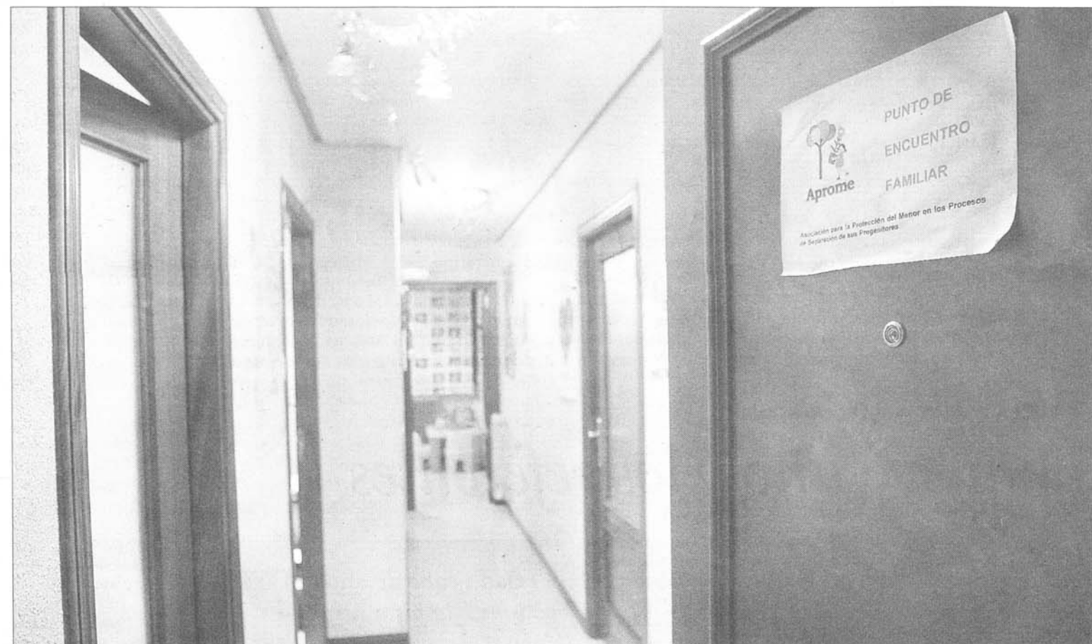
El piso simula una vivienda habitual, para que los niños puedan acostumbrarse a ella.

Unas visitas o unas entregas que se corresponden a 44 familias «que son con las que trabaja-