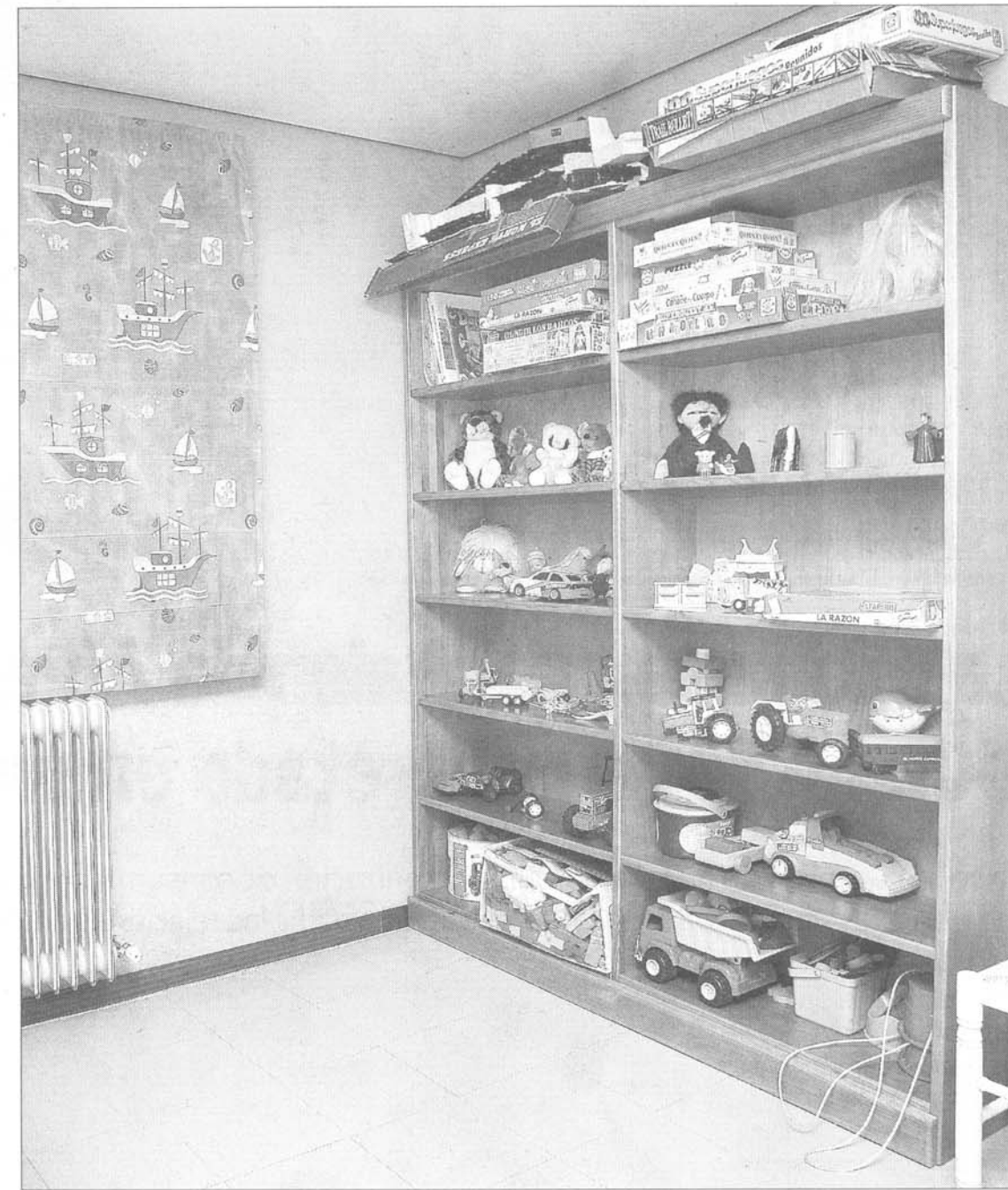
Para que los niños estén a gusto, tienen infinidad de juguetes para una posible espera.

Unas medidas que no son más comunes en los casos de visitas en el propio piso de la asociación. Si se considera que puede haber algún problema la visita se realiza con supervisión. «Pero eso lo debe mandar el juzgado o los servicios Sociales de la Junta».