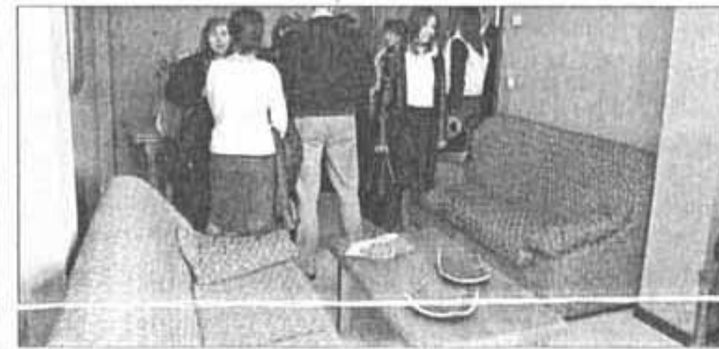
La sede tiene dos baños, cocina, salón y dos habitaciones.

El Punto de Encuentro Familiar de Palencia está ubicado en la calle Francisco Vighi, 23 bajo y tiene una superficie de unos 90 metros cuadrados. Cuenta con dos baños, un salón, una cocina, una habitación destinada para los niños y otra para los profesionales que allí trabajan.