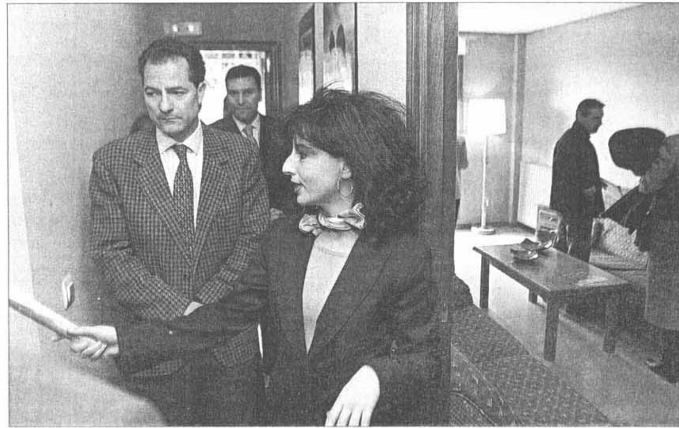
El punto de encuentro de la capital cuenta con todas las comodidades de un hogar, para que los encuentros se realicen en un ambiente sereno y apacible.